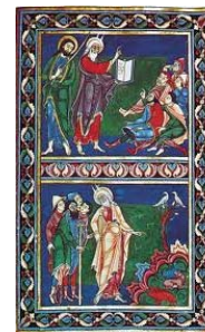
Bury Bible 繪圖本聖經

בָּרַךְ אֶתְּךָ בְּבֹאֶךָ וּבְרַךְ אֶתְּךָ בְּצֵאתְךָ: