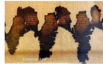
第二世紀希臘文蒲草紙抄本