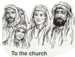
To the church

保羅向使徒陳明所傳的福音， 免得使徒否定他的宣教使命， 以致於不承認外邦信徒的地位， 會造成初代教會的分裂。