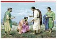
少年官求道与失道的教训