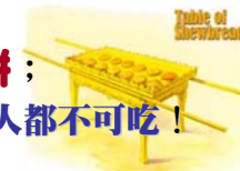
Table of Showbread

耶穌 回過頭來，提出一個 舊約的例證 ，記載在 撒母耳記 — 大衛 跟從他的人 飢餓 的時候，曾經吃過在 會幕 中所撤換下來的 陳設餅 ； 聖經 當中說 — 這個 餅 是除了 祭司 之外， 別人 都不可吃！