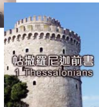
帖撒羅尼迦前書 1 Thessalonians